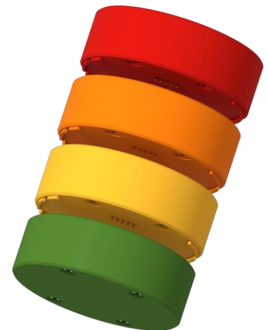
Abbildung 1: Aufbau einer Messstation aus mehreren Modulen

Konnektivität ist bei diesen Messstationen ebenfalls eine Seltenheit. Vorhanden ist diese fast ausschließlich bei Produkten aus dem hochpreisigen Segment. Hierbei wird allerdings meist keine direkte Verbindung zwischen den Geräten erzeugt, sondern das WLAN benutzt. Die Verwendung dieser Geräte ist daher nur an Orten mit ausreichendem Funkempfang möglich. Außerdem werden für die mobile Datenausgabe von den verschiedenen Herstellern meist unterschiedliche Systeme benutzt. Eine übersichtliche Ausgabe der Daten von verschiedenen Sensoren an einem Ort ist daher bisher nur schwer umsetzbar.