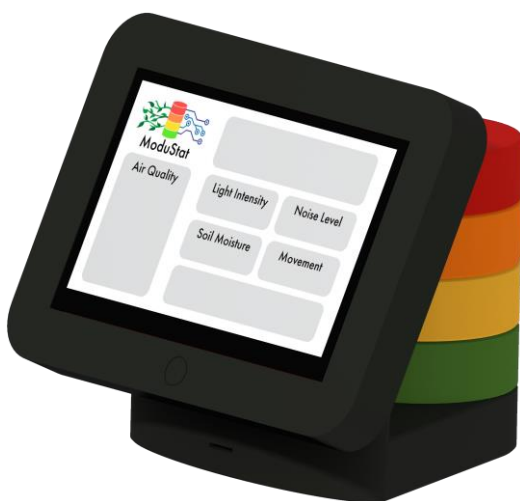
Abbildung 2: Zentrale mit mehreren Modulen

Aufgabe der Diplomarbeit „ModuStat“ war es ein innovatives und modulares System zu entwickeln und zu fertigen, mithilfe dessen einfach individuelle Messstationen zur Messung von Umweltdaten aufgebaut und zu einem Netzwerk verbunden werden können. Das bedeutet, dass alle Messstationen aus einer Vielzahl an verschiedenen Modulen mit jeweils individuellen Fähigkeiten zusammengestellt werden und anschließend untereinander eine drahtlose Verbindung in Form eines Mesh-Netzwerkes aufbauen. Durch die Modularität und die Konnektivität dieses Systems wird daher ein komplett neuer Produkttyp geschaffen.